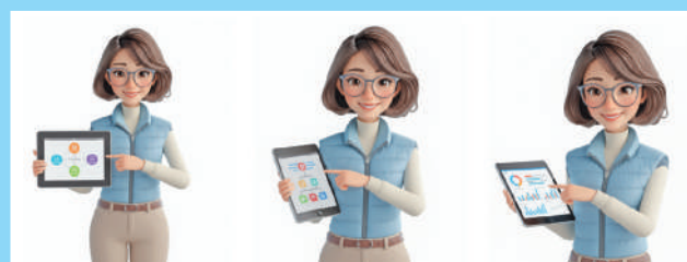
Norma, asistente virtual