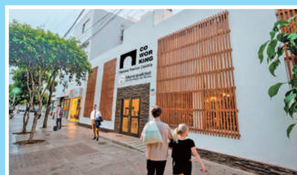
Coworking Mariscal Ramón Castilla