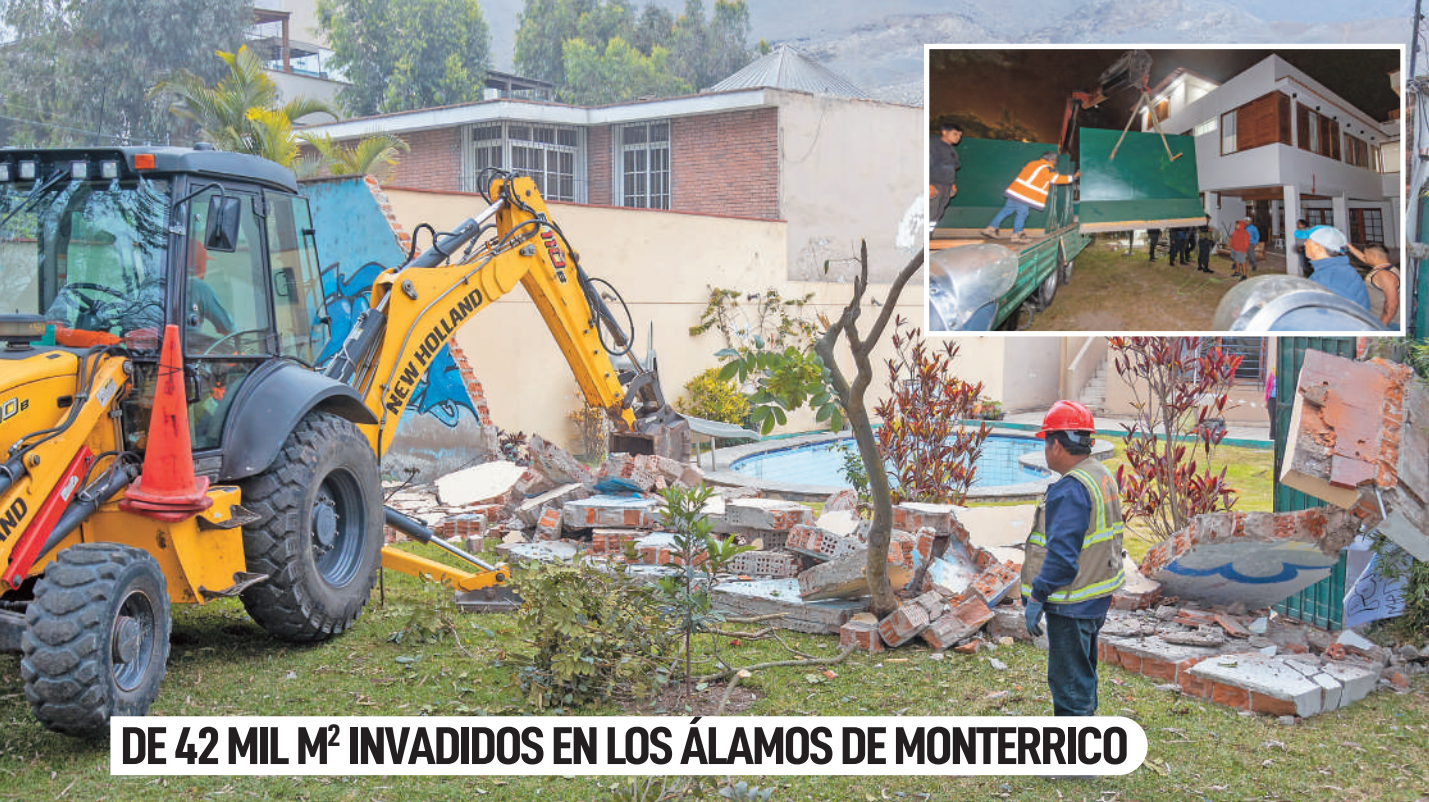
DE 42 MIL M 2 INVADIDOS EN LOS ÁLAMOS DE MONTEERRICO

Surco recuperó más de 20 mil m 2 de los 42 mil m 2 de espacio público ocupados indebidamente en los parques de la urbanización Los Álamos de Monterrico. El operativo, realizado con apoyo de la Policía Nacional y en el marco de la Ley N° 30230, permitió restituir áreas invadidas por particulares y devolverlas a la comunidad.