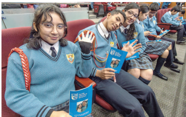
Municipio gestiona preparación académica de jóvenes surcanos en la Pre Lima y fortalece su camino hacia la educación superior, como parte del acompañamiento integral del FES.