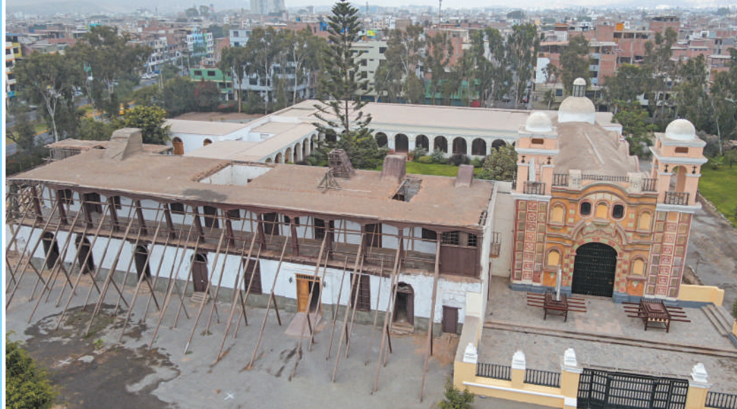
Hacienda San Juan Grande