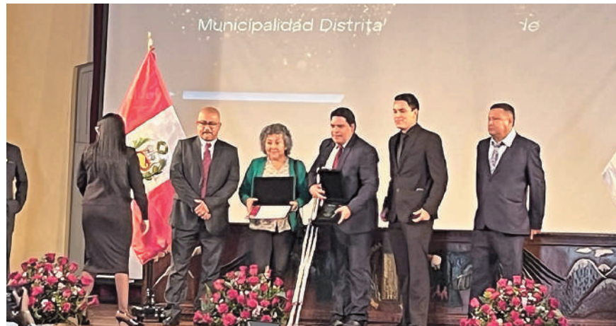
Reconocimientos a nuestra gestión del deporte nos llenan de orgullo y entusiasmo para seguir trabajando incansablemente por el bienestar de todos nuestros vecinos