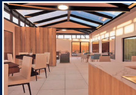
Clubes del Vecino: Chacarilla e Intihuatana

Espacio orientado para que los jóvenes practiquen música, estudien y desarrollen su talento.